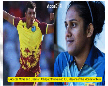
Gudakes Motie and Chamari Athapaththu Named ICC Players of the Month for May

(C) वेस्टइंडीज के बाएं हाथ के स्पिनर गुडाकेश मोती ने कई महीनों में शानदार प्रदर्शन के लिए आईसीसी मेंस प्लेयर ऑफ द मंथ जीता हैं। गुडाकेश पर्ल ने दक्षिण अफ्रीका के खिलाफ तीन मैचों में घरेलू सीरीज में काफी सफलता हासिल की थीं। महिला वर्ग में श्रीलंका की चमारी अथापथु को मई 2024 के लिए आईसीसी महिला खिलाड़ी का पुरस्कार दिया गया है।